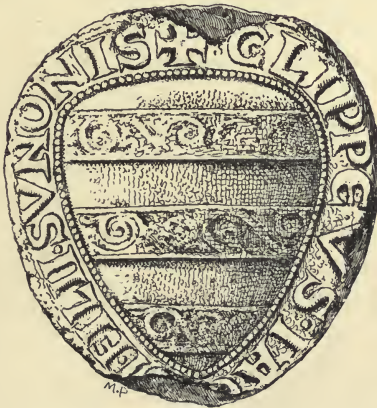
Fig. 4. Jacob Sunesøns Segl. (i Schwerins Arkiv).

Jacob Sunesøn af Møen, hvis Segl findes i Schwerins Arkiv hængende under Valdemar Sejrs og Prindsernes Udløsningstraktater 1225, 1230 (Fig. 4) 1) .