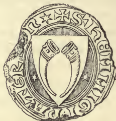
Fig. 6. Hemming Pedersøns Segl 1324 (Arnæm. Saml. LVI. 7).

thorp, der efter Bogstavformerne maa tilhøre Tiden ved 1300, træffe det samme Vaabenmærke stillet paa samme Maade i Skjoldet, er der forelagt tilstrækkelige Vidnesbyrd for, at det, tegnet som Nr. 58 og 59, har Hjemmel i en