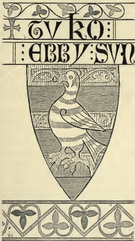
Fig. 2. Vaaben i Sorø-Frisen.

repræsentere jo nemlig for de ældre Led af Skjalm Hvides Stamme alene en Tradition. Paa den Tid — Slutningen af det 13de Aarhundrede — da Skjoldefrisen maaledes, levede knap