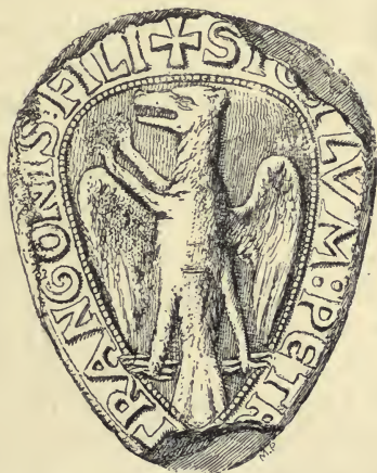
Fig. 7. Peder Strangesøns Segl 1230 (Schwerins Arkiv) 1) .

Det er ikke første Gang, at dette særegne Skjoldemærke viser sig i Skjalm Hvide Slægten. Det forekommer forud for Strange Andræsøn ført af Peder Strange-søn af Kalundborg († 1241), g. m. hans Moster Ingeborg, Esbern Snares Datter. Peder Strangesøns Segl findes i Schwerins Arkiv under et Diplom fra 1230, men Skjoldet er fejlt beskrevet i Meklenburgisches Urkundenbuch Nr. 374, som visende en Fugl med udspilede Vinger. Vaabenet dukker